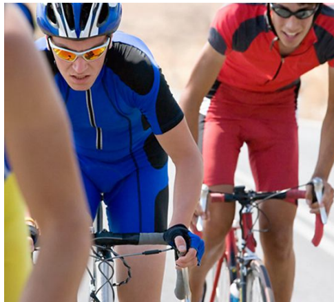
Gambar 3. Olahraga Triathlon

19 tahun yang direkrut dari tim skating Cina menunjukkan hasil yang memuaskan. Sebanyak 32 laki-laki dan 27 perempuan mendapatkan suplementasi dengan minuman karotenoid sebanyak 120 mL. Semua subyek menjalankan diet yang sama selama program pengamatan. Evaluasi dilakukan dengan alat yang disebut biophotonic scanner yang mampu mengukur skin carotenoids score (kandungan karotenoid pada kulit) sebagai marker antioksidan. Hasil penelitian menunjukkan terjadi peningkatan skin carotenoids pada atlet pria sebesar 38 dan 16% selama 4 dan 8 minggu latihan intensif, sedangkan pada atlet wanita sebesar 18 dan 22%. Hasil tersebut menunjukkan bahwa meningkatnya aktivitas antioksidan juga dipengaruhi oleh intensitas latihan ketahanan yang dilakukan. (Duan et al. , 2006).