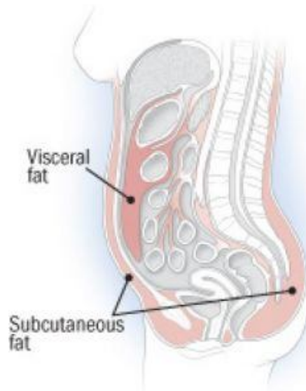
Gambar 5. Lemak di dalam rongga perut ( visceral fat ) dan lemak di lapisan bawah kulit ( subcutaneous fat ) (Sumber : Internet).

loss . Tetapi ternyata dalam penelitian ini, tikus-tikus yang disuplementasi fukoxantin selama 4 minggu, mengalami penurunan berat seperempat dari berat badannya (Tyler, 2009).